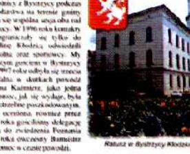
Kolonia w Bystrycy Kłodzkiej

W tym celu wypracowano plany działania, które będą służyły do wypracowania nowych rozwiązań w tym zakresie.