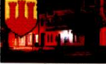
Spisak w Kaźmierzu

W tym celu wypracowano plany działania, które będą służyły do wypracowania nowych rozwiązań w tym zakresie.